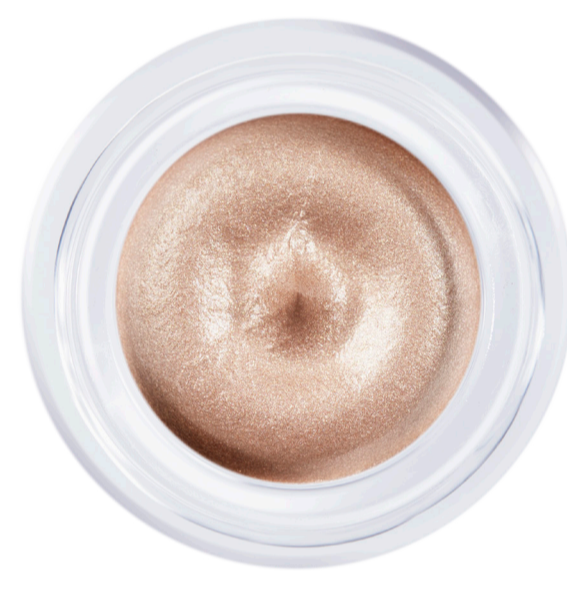
PIERRE DE LUNE